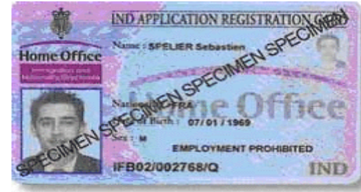
د کارت مخ